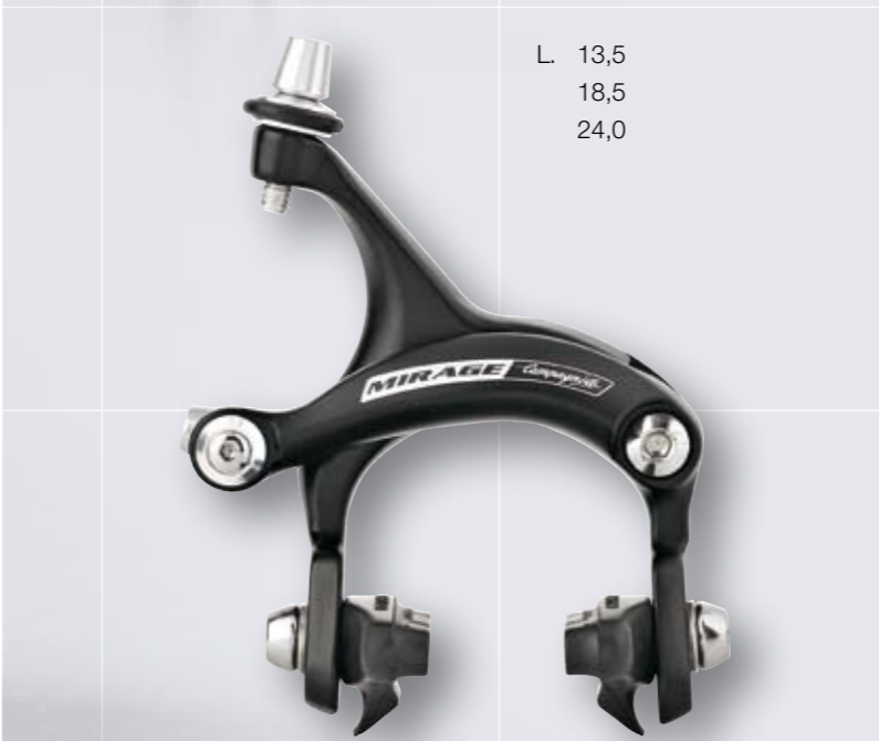
VR / HR